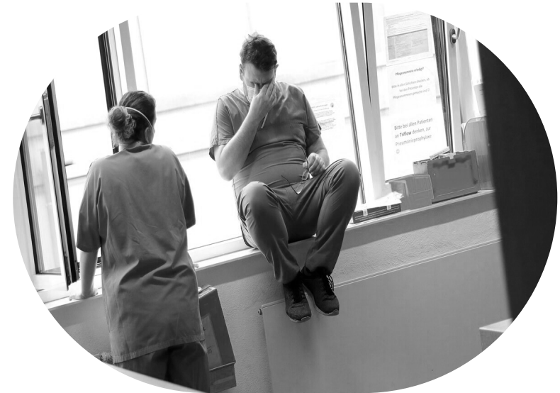
Radio Canada (2022)

Assurer le fonctionnement des services et des départements demeure un défi constant, particulièrement dans les milieux ruraux et au sein des communautés francophones et acadiennes.